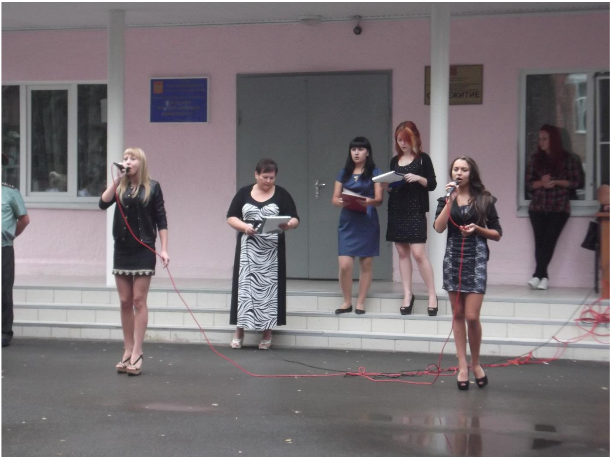
10.09.14г. День Кубани